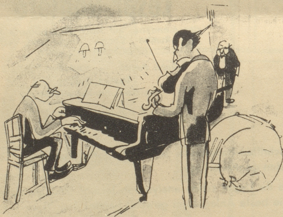
„Jetzt können wir ruhig Beethoven spielen, es ist ja kein Knochen mehr im Lokal.“