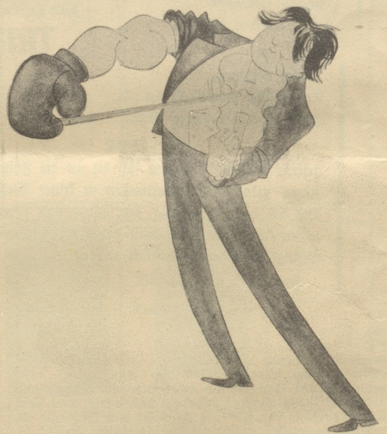
Kraft und Gefühl, der Musikboxer wäre eigentlich zeitgemäß.