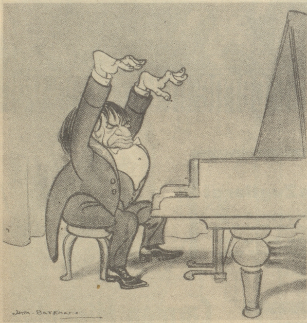
Ein Jubiläum: Zum tausendsten Male die „Appassionata.“