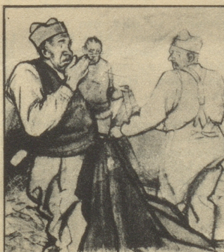
Und nun beginnt das übliche Morgen — Hust-Konzert — fast so unvermeidlich wie der weckende Korporal. Das kommt natürlich von dem langweiligen Strohstaub!