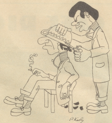
Das Neueste, der Guillotineschnitt, auch der Laie lernt ihn leicht

1 3 5 7 11 15 20 24 28 30 32 2 4 6 8 12 16 21 25 29 31 33 9 13 17 22 26 10 14 18 23 27 19