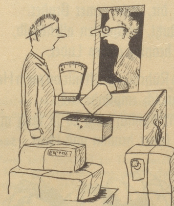
«Sie, wäred Sie so guet und würdet Sie mir das Formular usfülle, i ha mini Brülle vergässe!» Sonntagszeichner Schmid

Da öffnete der Tote die Augen und lächelte müde: «Laßt nur, Kinder, ich gehe auch zu Fuß!» —ans-