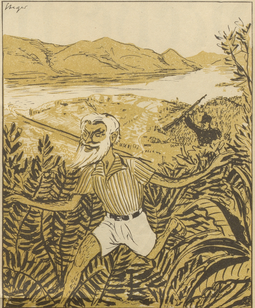
In Ascóna macht die Polizei Jagd auf Träger kurzer Hosen,

Mir müend üs halt wieder nööcher- cho ... aber nüd zum enand de Grind verschloh! Pizzicato