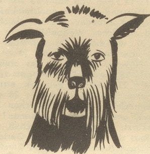
Alex heisst dies treue Hundetier.

«Oh, Mama — lueg: de säb Ma det hinkt mit em Chopf!» Boll.