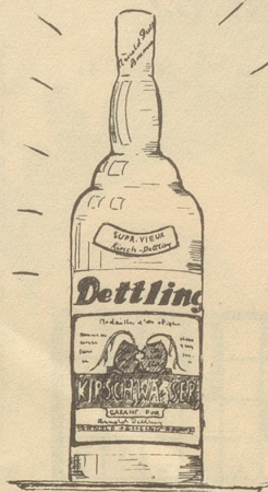
Arnold Dettling Brunnen

A. DÜRR & CO. AG. ZÜRICH Bahnhofstr. 69 „zur Trülle“ Bahnhofplatz 6