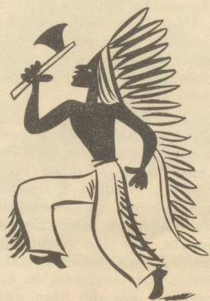
Der Sioux-Häuptling ist voll Mut,