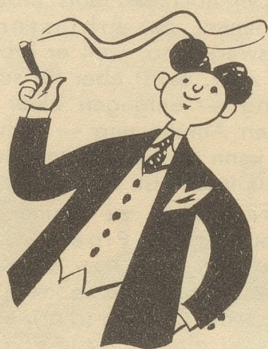
Der Sioux-Stumpfen duftet gut!