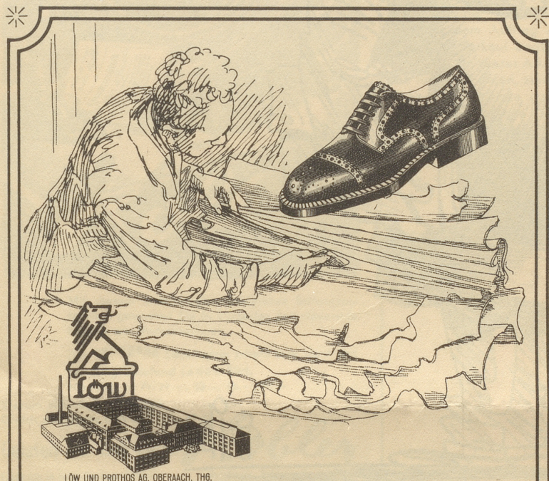
LÖW UND PROTHOS AG. OBERAACH, THÜ. —

DIA MIL, der schräge Schnitt, nimmt die stärksten Bärte mit!