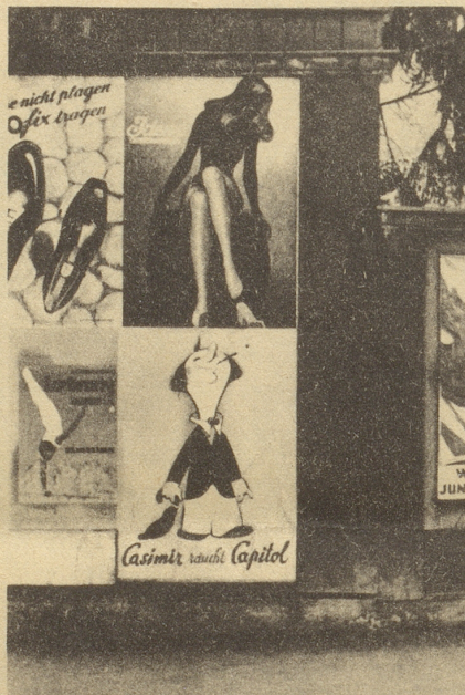
Casimir der Vielgenießer!