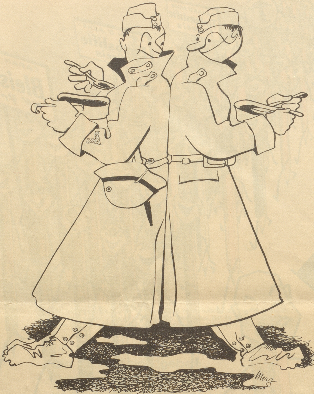
Siamesische Zwillinge, eine häufige Erscheinung in der Armee