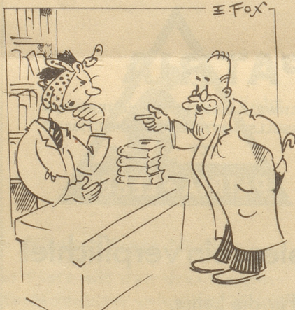
Im Bücherladen «Haben Sie Schopenhauer?» «Nein, Zahnweh!»

Auflösung: Imene freie Land dörf me no sini Meinig säge!