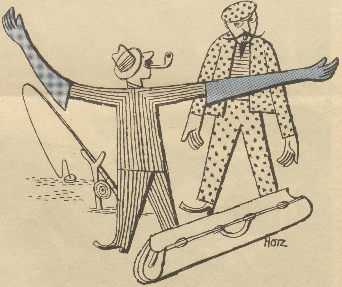
— — — soo grooß!!“