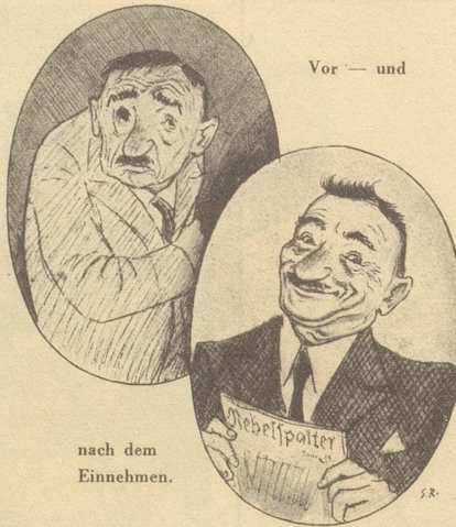
nach dem Einnehmen.

«Nein», entgegnete der König, «sie wird größer sein, — denn sie wird länger bestehen.» (Deutsch von E. W.)