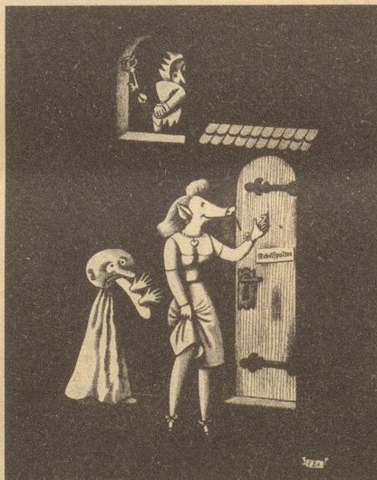
Der Nebelspalter meidet die Zote und den billigen Spott