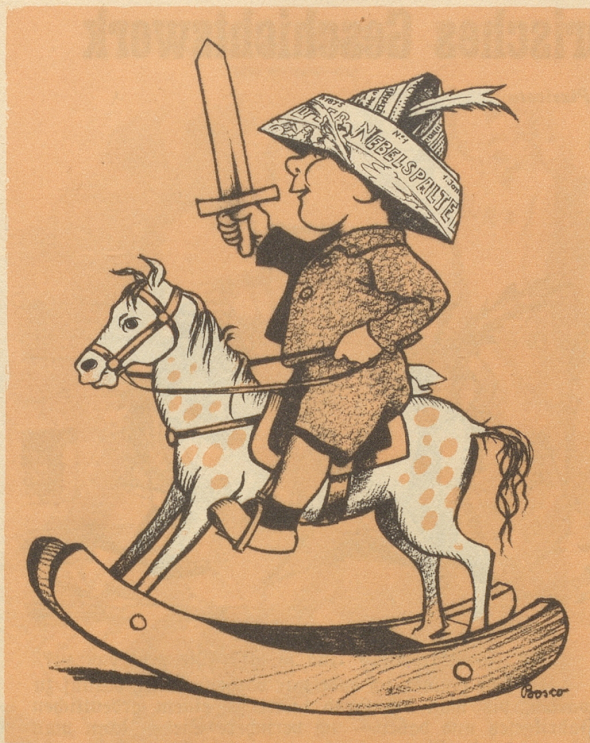
Unser Mitarbeiter Boscovits jun. und die erste Nebelspalternummer anno 1875