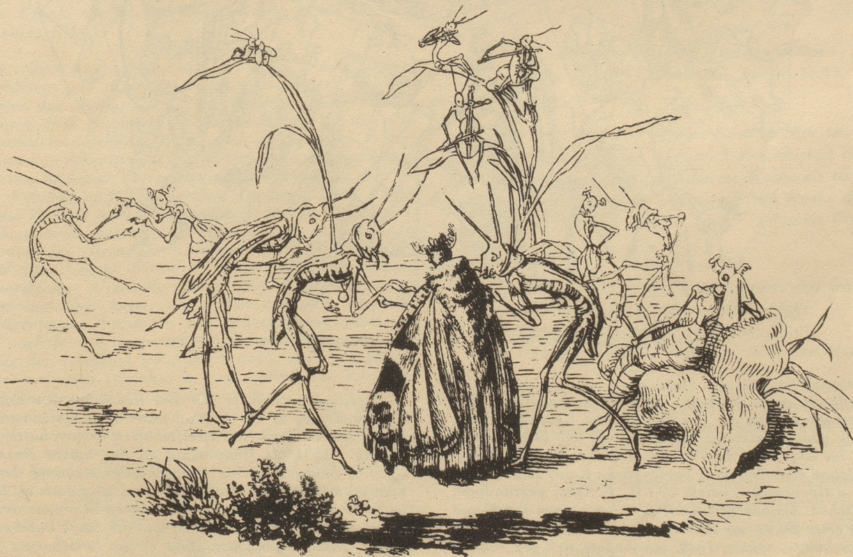
Ballszene, Federzeichnung, Kunstmuseum Solothurn.

man im feinen und sicheren Strich Distelis etwas von der Zeichnung des Illustrators der Nibelungen. Allerdings, dessen oft spröden, trocken wirkenden Historismus wußte der aggressive Solothurner ins Saftige, Lebensvolle und Volkstümliche umzuformen, die höfische Distanziertheit ersetzte