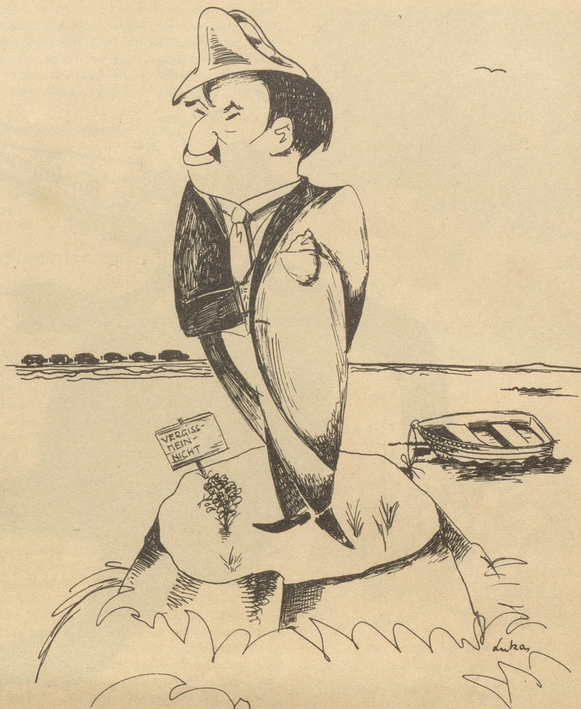
Laval auf der Insel Mainau