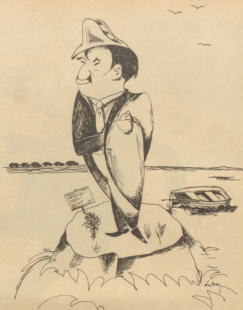
Laval auf der Insel Mainau