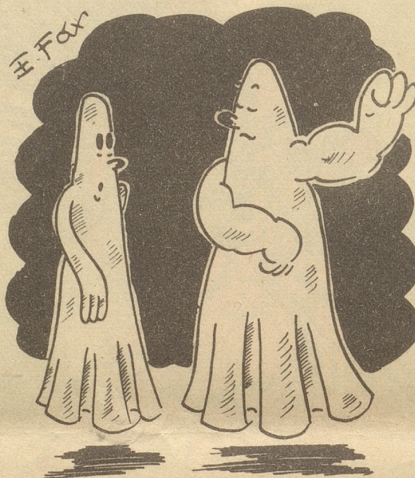
Geister unter sich „Sehen Sie, solche Muskeln bekommt man vom vielen Tischrücken!“