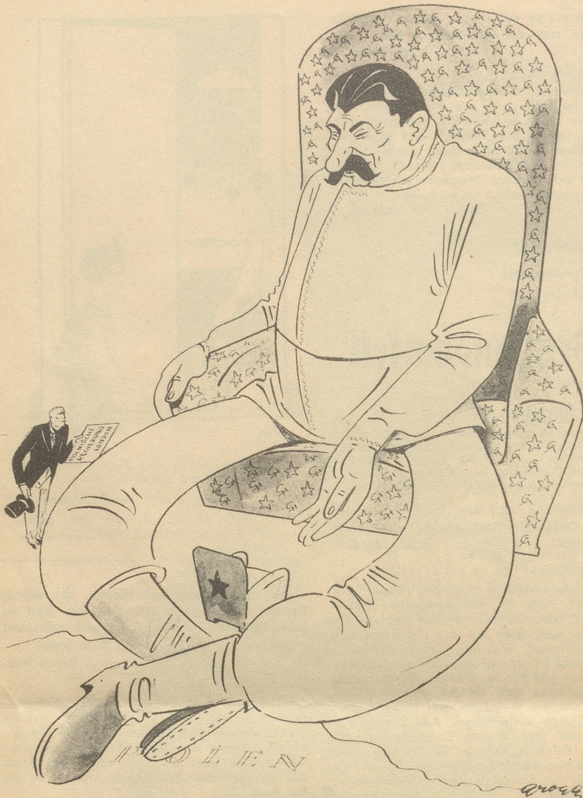
Stalin erklärt eine Zusammenkunft mit dem polnischen Nationalcomité noch als verfrüht

„... oder, wenn Sie bitte hier Platz nehmen wollen!“