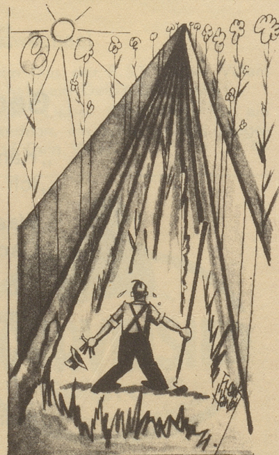
... im August, beim Jäten