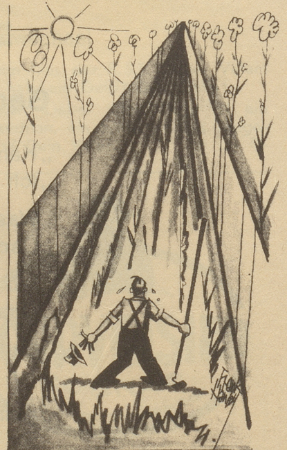
... im August, beim Jäten