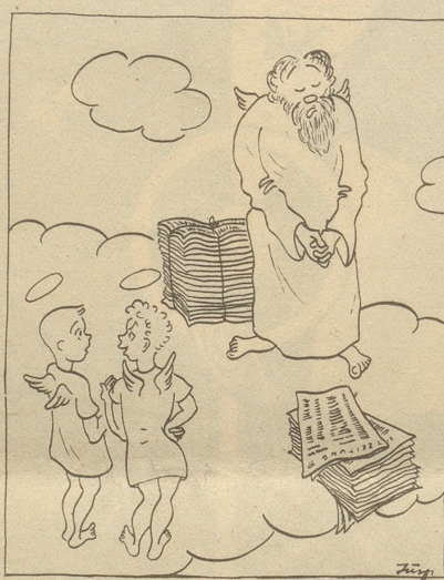
„Das isch de Gueteberg. Er bereut sini Erfindig!“