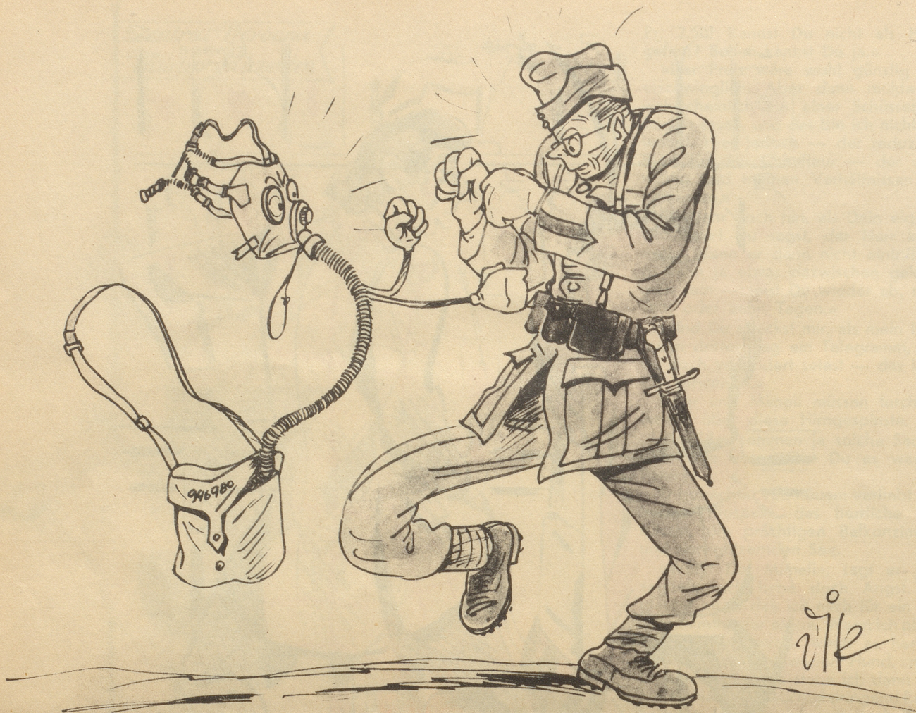
6. Bild aus Diks Kriegs-Skizzenbuch