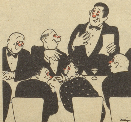
Die Heuschnüpfler feiern das Ende der Heuernte