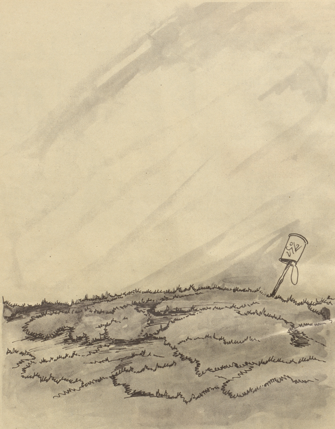
4. Bild aus Diks Kriegs-Skizzenbuch