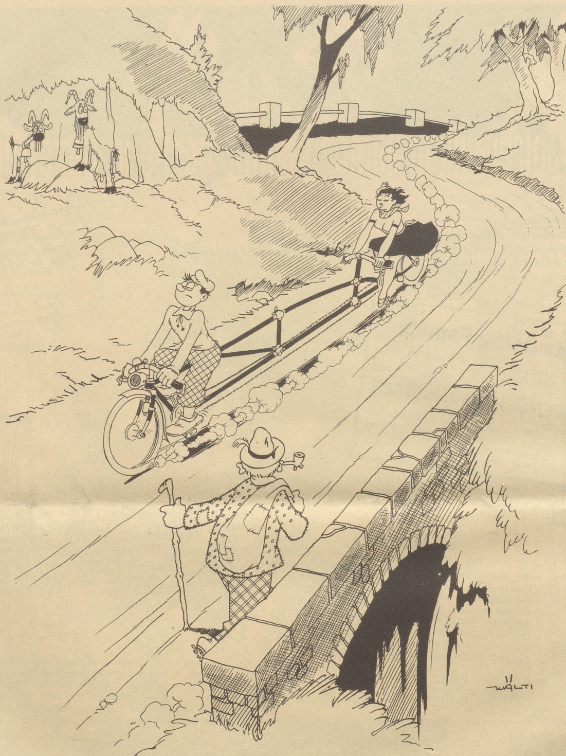
Die Flitterwochen sind vorbei, das Tandem wird verlängert