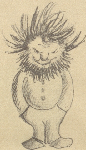
Siehst Du den Mann mit wilder Mähne? Im Herzen ich ihn milder wähne.

Für den «Nebenspalter» herausgelesen von G. E.