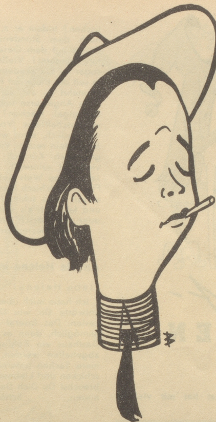
Barhäuptiger junger Mann

Am nächsten Sonntag gab es dann richtig einen schwarzen Kaffee aus der neuen Maschine. An einem Ort füllte man Wasser, an einem zweiten Kaffee und an einem dritten Sprit ein. Wir zündeten an — das war gleich nach dem Mittagessen — und warteten. Wir warteten eine viertel, eine halbe, dreiviertel Stunden. Eine Stunde nach dem Mittagessen warteten wir immer noch. Mein Vater meinte anzüglich, die Araber pflegten während der Kaffezubereitung Märchen zu erzählen, um sich die Langeweile zu vertreiben. Der Titel «Tausendundeine Nacht» lasse tief blicken — ob man übrigens nicht heißes Wasser hätte einfüllen können? Meine Schwester verneinte: irgend etwas von den Glaskugeln, Glasröhren, Glaskolben und Glasdeckeln hätte springen können. Mein Bruder hob die Vorzüge des Nescafé hervor. Als dann — eben nach einer Stunde — sich entscheidende Ereignisse innerhalb des beschriebenen Glaspalastes ankündigten, atmeten wir auf. Jemand bemerkte sehr richtig, man sei keine Stunde mehr sicher, daß es Kaffee gebe. Und schon brodelte es in der einen Kugel, quirlte es in einer Röhre, zischte, dampfte, tropfte und gurgelte es. Das Wasser wurde hellbraun, etwas dunkler, dann näherte es sich der Farbe, die man von einem Kaffee erwartet.