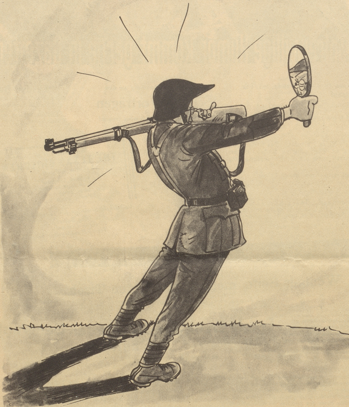
2. Bild aus Diks Kriegs-Skizzenbuch