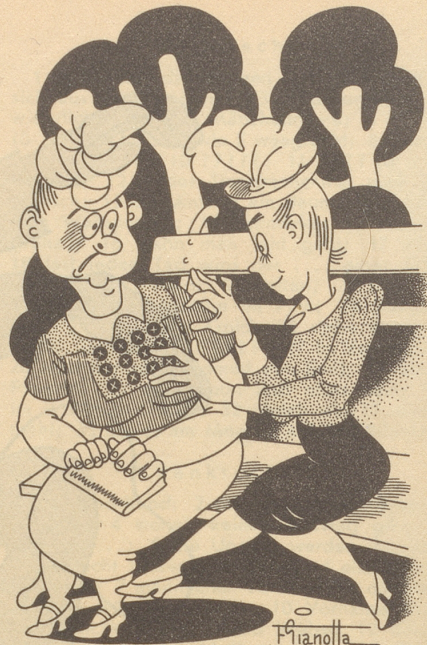
Dactylographin trifft Dame mit Knöpfen

Ich will nun nicht etwa eine große Kritik vom Stapel lassen (oh nein), denn ich bin ein friedlicher Mensch und möchte mich nicht mit Dir streiten. Im Vertrauen gesagt: ich bin nicht ganz sicher, ob meine Anklage begründet ist. Aber ich muß es Dir sagen. Obwohl es mir schwer fällt. Also hör zu. Ich hätte (wie sag ich's meinem Kind), also ich hätte I. M. (Ihre Majestät) geschrieben und nicht S. M. (Seine Majestät).