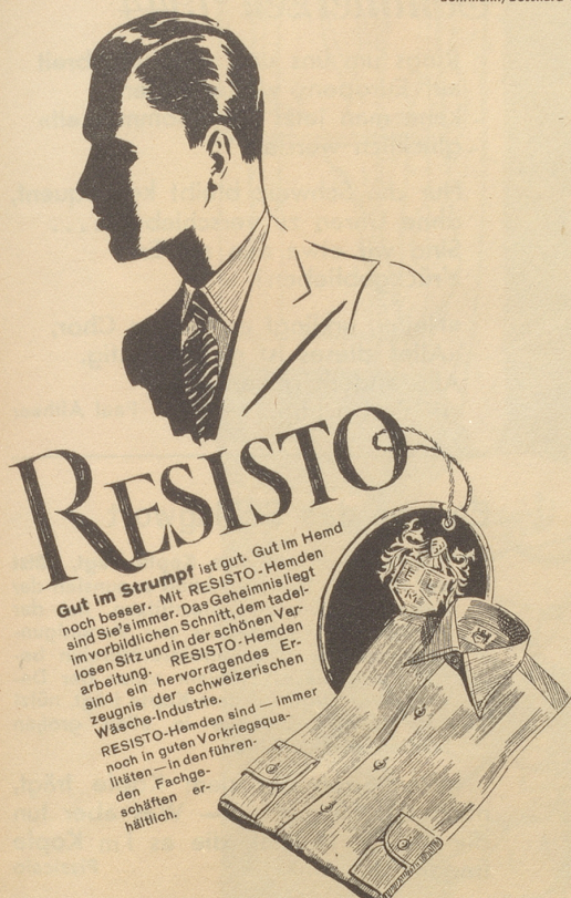
RESISTO das klassische Hemd des eleganten Herrn