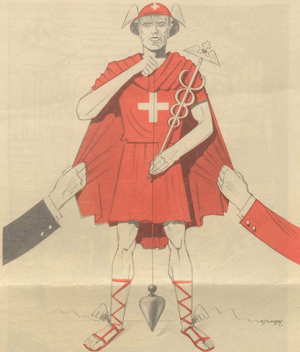
Mustermesse 1944: „Sänkrächt und fescht — das isch 's Bescht!“