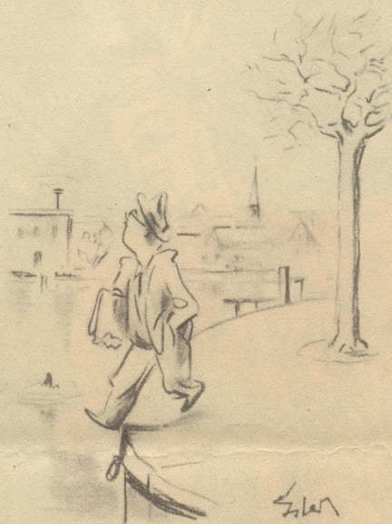
Gefahren aus der Luft

«Ein mächtiger Herzog wollte die Schweizer bekriegen. Er hielt mit seinen Räten Ratschlag, wie man die Sache anstellen sollte, daß man zu ihnen ins Land käme. Nun hatte der Herr einen kurzweiligen Narren, den fragte er auch scherzweise, was er dazu räte. Der Narr antwortete: Es gefällt mir garnicht. Ihr erratet alle, wie man hinein, und keiner, wie man wieder herauskommen möge. Es war dies eine gewisse Prophezeiung des Narren, denn der Herzog wurde mit den Seinen von den Schweizern erschlagen.» h.