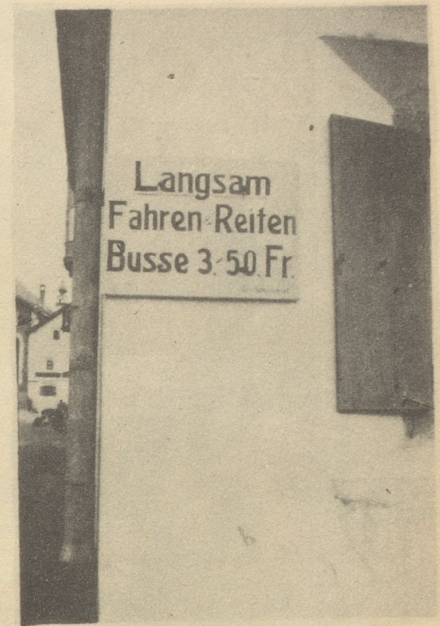
Da isch me schöö am Seil miteme alte Gaul!

Hei, ging da ein Aufschrauben durch die Mannen. Der Fourier schlug seine Absätze zusammen und kam mit seiner Schuhschachtel voll Soldsäcklein dahergerannt. Es ging nicht lange ... so hatte ich vier funkelnege neue Fünfernötlein in der Hand. Jetzt aber los, wie die Kugel aus dem Rohr, zum nächsten Bäcker. Mit einem großen Sack voll Makrönli und Bretzeli und einem Nötlein weniger stieg ich bald wieder die ausgetretenen Stufen herunter und begab mich auf die Suche nach einem idyllischen Platz für meine Galgenmahlzeit. Diese wurde auf einer Holzbeige, plaziert zwischen einer Blumenwiese und einem Murbelbach, abgehalten. Genießerisch drückte ich die weißen, braunen und gelblichen Guetzli in