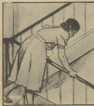
„Ist denn Ihrer auch noch nicht daheim? Bei dem schlechten Wetter holen sie sich gleich den Husten!“