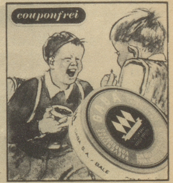
„Keine Angst, ich gebe dem Buben immer Gaba auf den Schulweg mit. Gaba schützt vor Husten und Heiserkeit.“