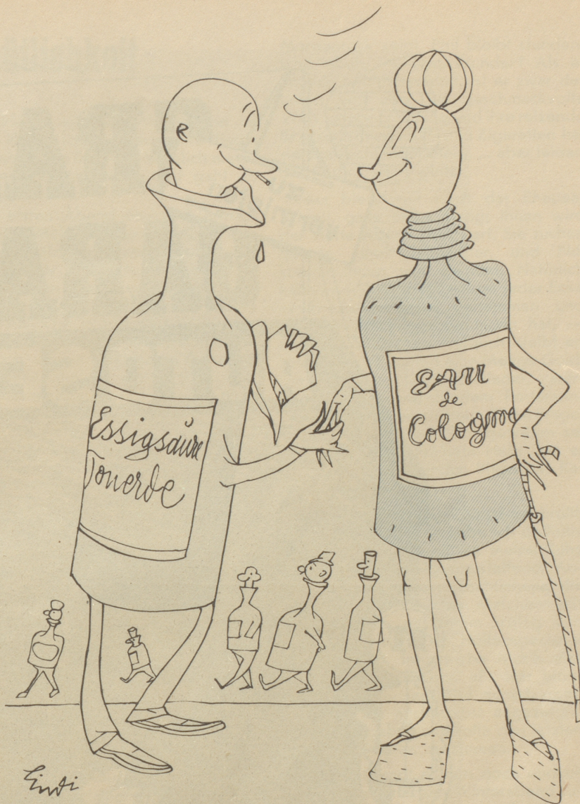
Schlichte und vornehme Gütterli finden sich und wandern zur Sammelstelle

er seinen Sitz in «Paradies» hat. Dieser Ort ist ebenso nahe an der thurgauischen Grenze gelegen wie der Zweck des Vereins an der Grenze des Gesetzmäßigen liegt. Es sollen vor allem die Schaffhauser sein, welche dem Verein beitreten, denn der verbotene Tanz beim Nachbar hat mehr Reiz, als der erlaubte zu Hause. Sch.