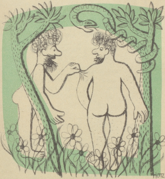
Der elegante Herr trägt Haut

„Wötted Sie Ihren Anzug nüd emal wende laa?“