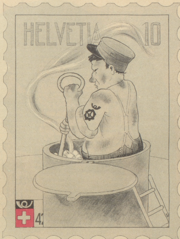
Erster Vorschlag für eine zu schaffende Serie „Postalische Berufe“ Der Postschofför!