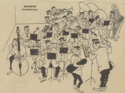
«Herr Kapellmeister, ich bin fertig; darf ich gehen?» Ric et Rac

«Hallo, ist dort Müller und Weber!» «Ja, was wünschen Sie?» «Sagt man Kleópatra oder Kleopátra?» «Wie sollen wir das wissen?» «Im Adreßbuch steht doch, daß Sie eine Beton-Firma sind!» ore