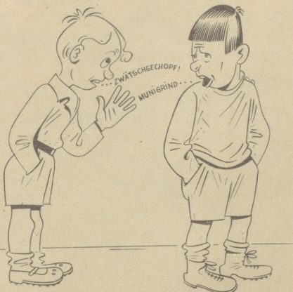
Nüd bekannt! Wowoll!

Der «Bund für Schwyzertütsch» stellt fest, daß der Jugend die Dialektausdrücke auch für die üblichsten Pflanzen- und Tierbezeichnungen vielfach nicht mehr bekannt sind.