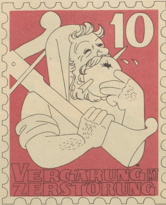
Entwurf von Büchi