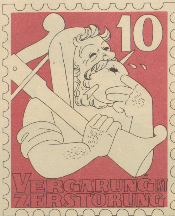
Entwurf von Büchi