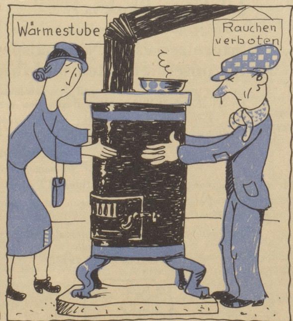
Wo man heizt, da lass dich ruhig nieder!