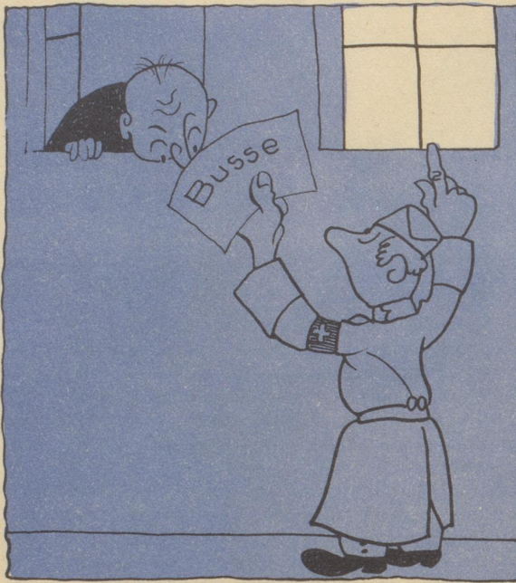
Wo viel Licht ist, gibts viel Bußen!