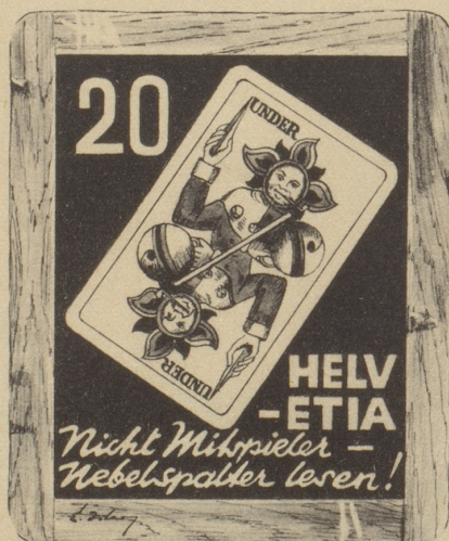
Aus unserer Briefmarkenbilder-Serie