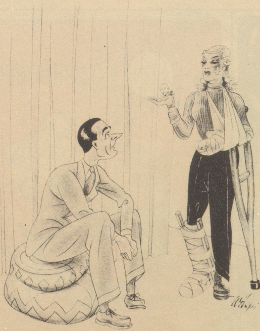
„Weisch ich tue mis neu Après-Ski-Kostüm usprobiere.“