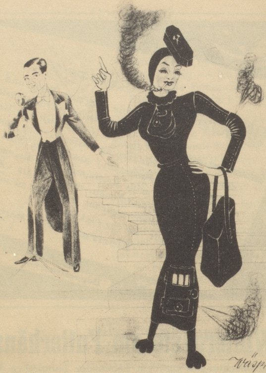
„s neueschte Wintermodell: Dauerbrenner!“