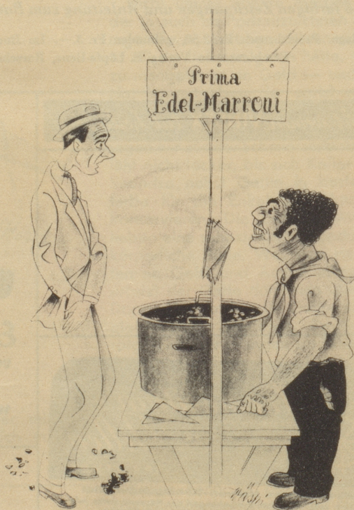
„Gänds mer för zwanzg Rappe Marroni.“ „Wolle Sie eini großi oder swei glini?“

LUGANO ADLER-HOTEL und ERICA-SCHWEIZERHOF beim Bahnhof. Seeaussicht. Bes. KAPPENBERGER