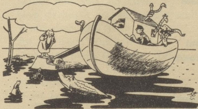
Noah: Söll ich ächt d'Amphibie i d'Arche neh — oder im Wasser loh? Marc' Aurelio