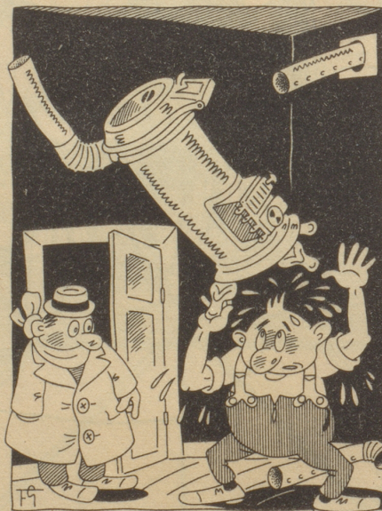
Hundertfüßgmal schtemme, dann git er warm!

Ein schönes Dorf «irgendwo» im Bernerland. Unsere Einheit, die ein paar Tage zuvor eingerückt ist, feiert den 1. August mit der Dorfbevölkerung. Nach all den musikalischen und ge- sanglichen Produktionen und der An- sprache auf der Exerziermatte, zieht der ganze Zug zurück ins Dorf, wo die Musik zum Abschluß einen letzten Marsch schmettert. Unsere Kompagnie, die mit geschultertem Gewehr im Zuge mitmarschierte, hält an. Der jüngste Leutnant kommandiert vor dem Ab-