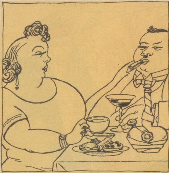
1940 Rheumatisme und Buuchweh!