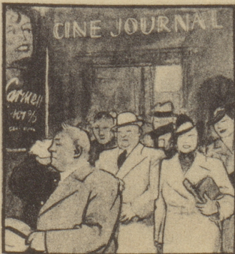
Die Kinobesucher sind noch ganz benommen von allem Gesehenen und von der Hitze im Saal. Draußen geht ein kalter Regen nieder.

Manch Fräulein tut nach langen Wegen Sich Rot auf Mund und Wangen legen.