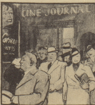
Die Kinobesucher sind noch ganz bekommen von allem Gesehenen und von der Hitze im Saal. Draußen geht ein kalter Regen nieder.

Manch Fräulein tut nach langen Wegen Sich Rot auf Mund und Wangen legen.