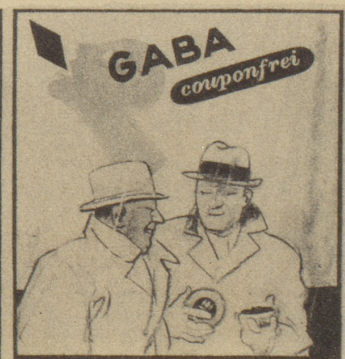
„Der Schirm ist gut, aber mir sind meine Gaba noch wichtiger. Bitte, bedienen Sie sich!“ Ob's windet, regnet oder schneit, Gaba schützt vor Heiserkeit!