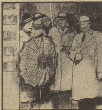
Freys und Flurys können den Heimweg zusammen antreten. Sie wohnen ja Tür an Tür.