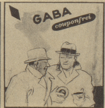
„Der Schirm ist gut, aber mir sind meine Gaba noch wichtiger. Bitte, bedienen Sie sich!“ Ob's windet, regnet oder schneit, Gaba schützt vor Heiserkeit!