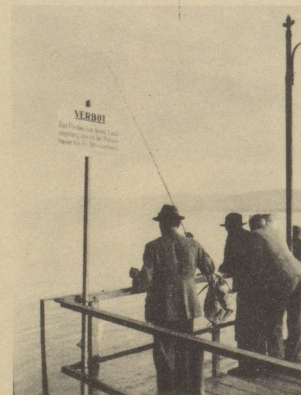
Idyll am Zürisee

In der «Eintracht» gehen die Wogen der Diskussion hoch. Hohe Preise — hohe Löhne, niedrige Preise — niedrige Löhne, das sind die beiden Meinungen die mit Vehemenz aufeinanderprallen. — Schließlich fragt einer der Streit-